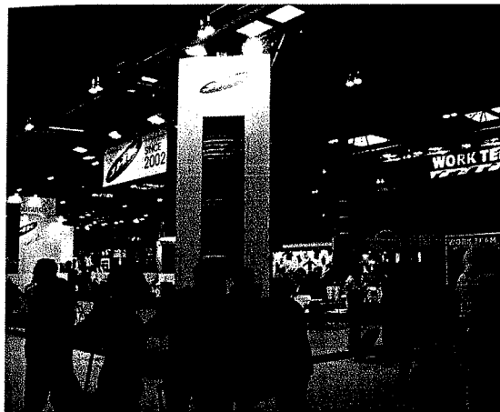
JHK Trader fue una de las marcas en textil promocional con una presencia más activa en Expo Reclam.

diarios que se acercaron a la zona de entrega de la bolsa publicitaria; la guía del visitante, con el plano de ubicación de todos los expositores; la zona Primer Paso, donde se ubicaron todas las empresas que exponían en Expo Reclam por primera vez; o el servicio de mensajería de MRW, con condiciones muy favorables a los visitantes del salón.