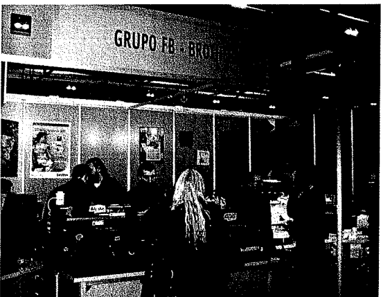
La impresora textil GT-541 que permite imprimir directamente desde un ordenador o desde una tarjeta de memoria, evitando así la complicada configuración y el elevado coste de las impresoras de serigrafía tradicionales, fue protagonista del stand de Grupo FB - Brother.

diarios que se acercaron a la zona de entrega de la bolsa publicitaria; la guía del visitante, con el plano de ubicación de todos los expositores; la zona Primer Paso, donde se ubicaron todas las empresas que exponían en Expo Reclam por primera vez; o el servicio de mensajería de MRW, con condiciones muy favorables a los visitantes del salón.